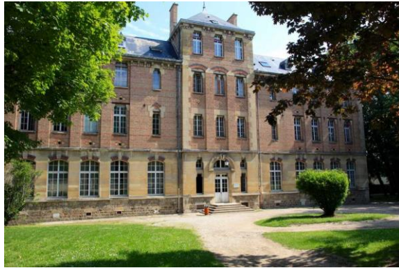
La Bibliothèque des CPGE.